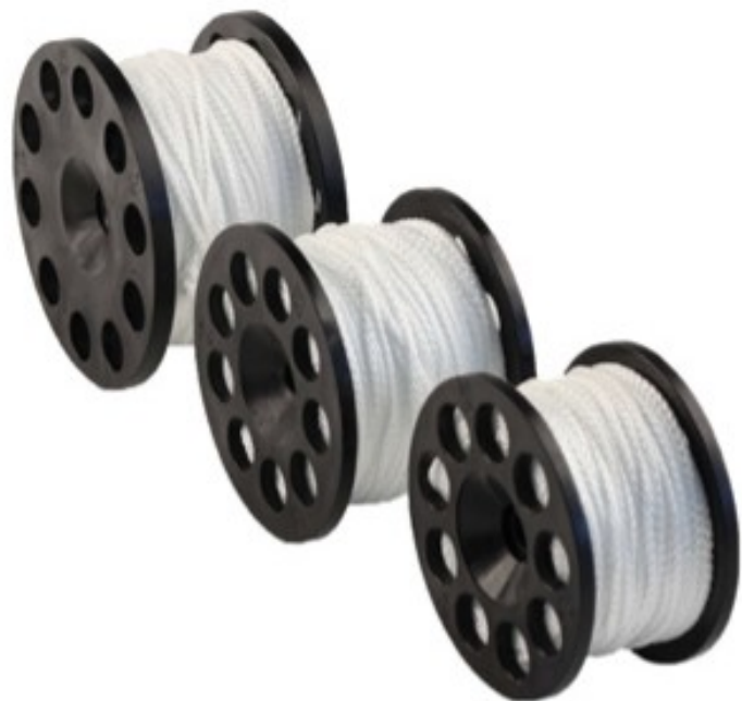
Rodzina szpułek Defender Pro™

Halcyon Defender Pro™ jest dostępny w trzech rozmiarach 100, 159 oraz 200ft – ( 30m, 45m, 60m). Do każdego z nich można zastosować adapter EasyGrip™. Przy używaniu adaptera EasyGrip™ z Defender Pro™ 200, musisz wyregulować śrubę blokującą tak, aby pasowała do otworów w szpulce. Defender Pro 200 może być używany z uchwytem w stylu kołowrotka Pathfinder™, adapterem EasyGrip™, bądź bez żadnych dodatków jako zwykłą szpulkę.