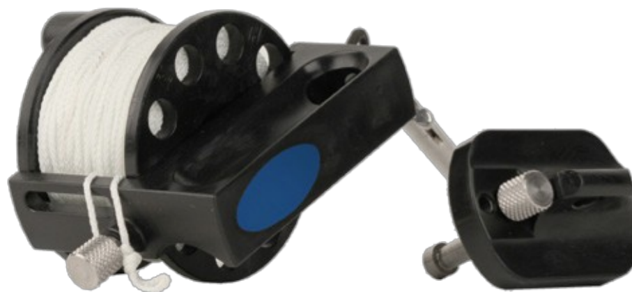
Defender Pro™ 200