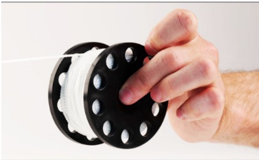
Defender™200 może być użyty jako zwykła szpulka