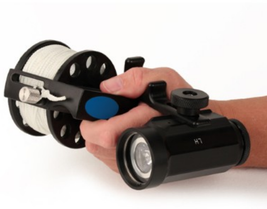
Uchwyt współpracuje z latarką Mini-Explorer™