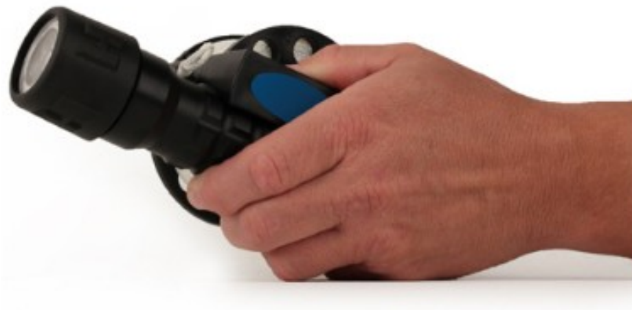
Wyprofilowany uchwyt mieści latarkę zapasową Scout™