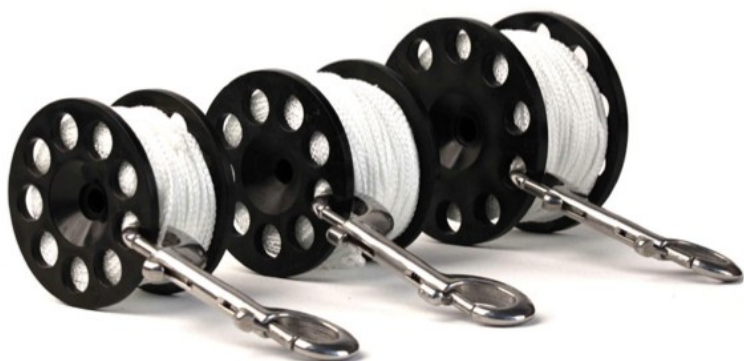
Szpulki Defender Pro™

Linia kołowrotek i szpułek Halcyon Defender Pro™ została poszerzana z biegiem czasu o szpulki Defender Pro™ oraz sprawdzony w praktyce kołowrotek Halcyon Pathfinder™, zapewniając zwiększoną elastyczność i unikalne funkcjonalności.