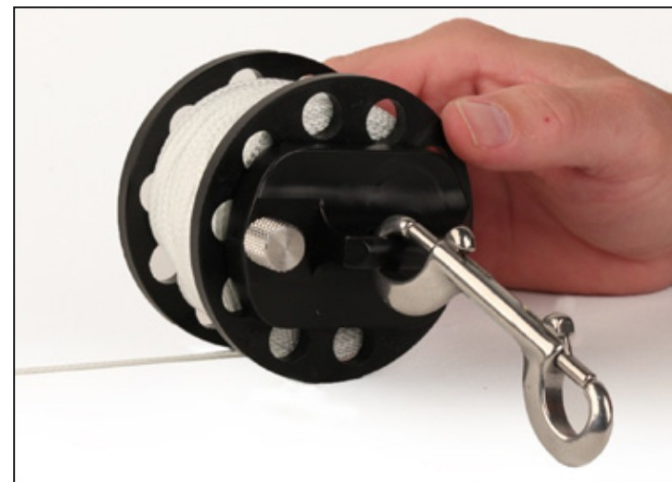
Szpulka Halcyon Defender Pro™ z adapterem EasyGrip™

Szpulki Defender Pro™ są zazwyczaj kupowane w zestawie z adapterem EasyGrip™. Ten adapter wykorzystuje dwustronny karabińczyk, jako wytrzymały i wygodny uchwyt. Adapter EasyGrip™ może być zamocowany na stałe, blokując szpulę, lub z możliwością swobodnego obracania szpulki. Powinieneś poeksperymentować i sprawdzić który sposób mocowania adaptera odpowiada Ci najbardziej w zależności od sytuacji w której wykorzystasz Defender Pro™. Na przykład, w trakcie puszczenia boi dekompresyjnej, możesz odblokować adapter i pozwolić na swobodny obrót szpulki, a po zakończeniu zablokować adapter aby pomógł utrzymać Twoją pozycję, lub aby wygodniej nawijać linkę na szpulę.