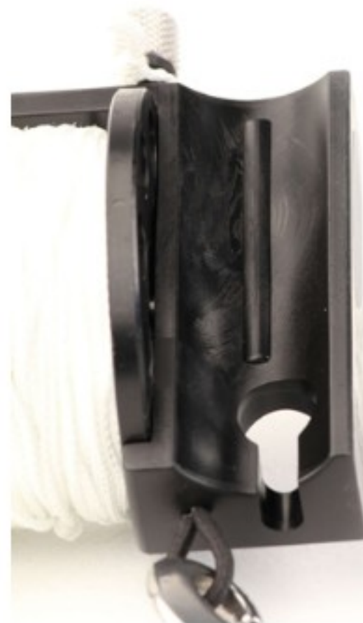
Podniesiony uchwyt zapobiega wyślizgnięciu