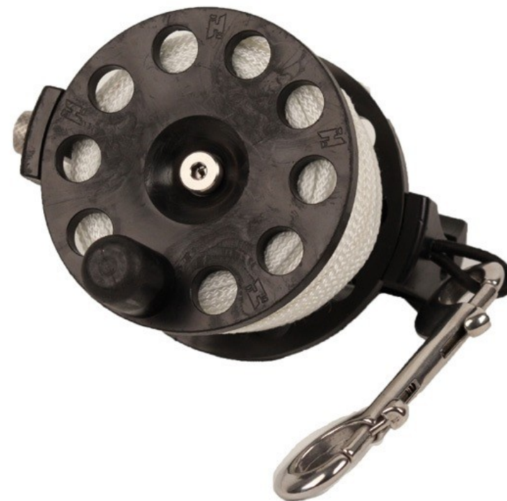
Defender Pro™ 200

Halcyon Defender Pro™ 200 jest unikalnym urządzeniem, łączącym w sobie cechy skutecznego urządzenia jakim jest kołowrotek Halcyon Pathfinder™ z elegancką prostotą szpulki Defender Pro™. Defender Pro™ 200 może być szybko przekonwertowany ze funkcjonalności kołowrotka Halcyon Pathfinder™ na funkcjonalność szpulki Halcyon Defender Pro™, zachowując wszystkie benefity z zainstalowanego adaptera EasyGrip™.