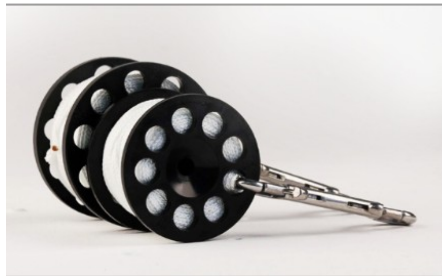
Defender™ 200 jest niewiele większy niż Defender 150™