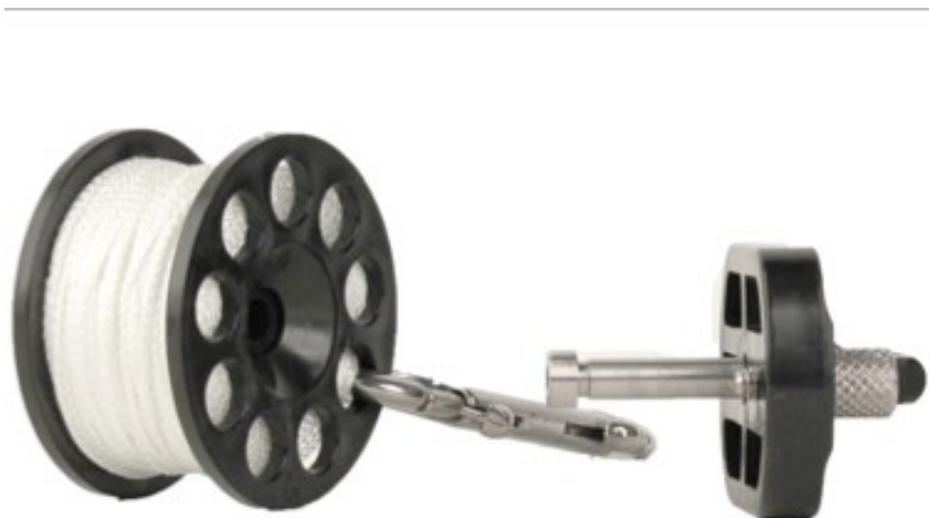
Szpulka Defender Pro™ z adapterem EasyGrip™

Dostosowanie szpulki Defender Pro™ pod preferowany sposób wykorzystania jest bardzo proste. Użyj klucza imbusowego w rozmiarze 5/32" (4mm) aby zainstalować adapter EasyGrip™. Upewnij się, że wrzeciono jest dobrze dokręcone, tak by nie wypadło ze szpulki. Wrzeciono może być łatwo zdemontowane, pozostawiając szpulkę w standardowej konfiguracji.