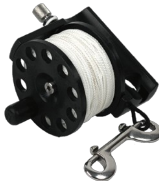
Kołowrotek Defender Pro™ 200