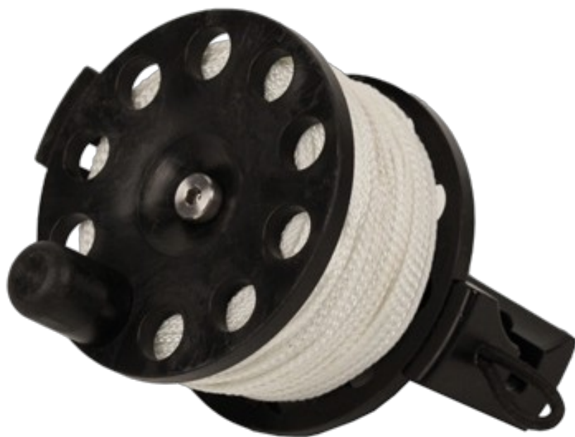
Defender Pro™ 200

Halcyon Defender Pro™ wykorzystuje unikalne, wytrzymałe śródek szpulki, który został zaprojektowany tak, aby pomieścić funkcjonalne wrzeciono, które przekształca szpulę Defender Pro™ ze zwykłej szpulki w hybrydę szpulki i kołowrotka. Ten nowy wzór wykorzystuje innowacyjny adapter EasyGrip™, który przekształca dwustronny karabińczyk w poręczny uchwyt. Adapter EasyGrip™ może być zablokowany w miejscu, lub zwolniony zapewniając funkcjonalność zbliżoną do kołowrotka. Tymczasem Defender Pro™ 200 zawiera w pełni funkcjonalny uchwyt, zbliżony do tego w kołowrotku Pathfinde™r. Pozwalający na operację w trzech trybach (szpulka, kołowrotek, hybryda).