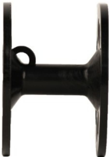
Uchwyt na linkę zapobiega jej utracie