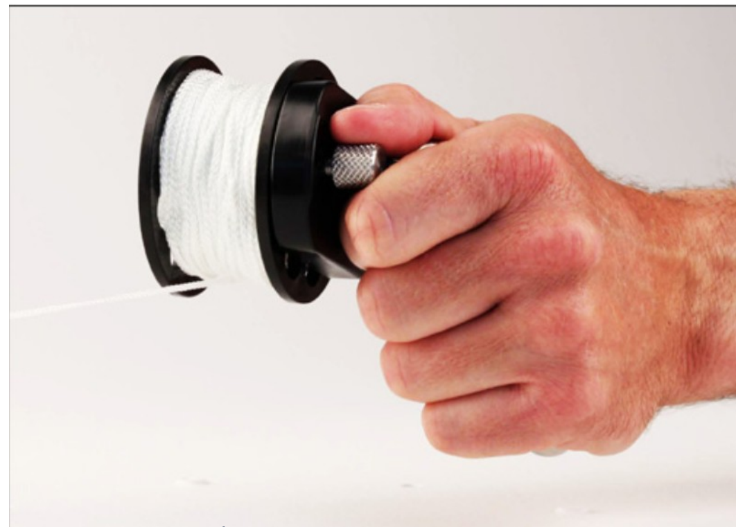
Adapter EasyGrip™ w użyciu

Innowacyjny adapter EasyGrip™ od Halcyon jest idealny dla sytuacji w których nurek potrzebuje lepszego chwytu szpulki. Na przykład, nurek wypuszczający boje, może potrzebować lepszego chwytu; nurek używający rękawic, może mieć kłopoty z utrzymaniem palców aby nie zaplątały się w zwijaną linkę na szpulce. Adapter EasyGrip™ jest również wygodny w użyciu w trakcie rozwijania linki, czy to w trakcie wypuszczania boi czy w nurkowaniu jaskiniowym w trakcie poręczowania. Nurek powinien ćwiczyć użycie śruby blokującej w adapterze EasyGrip™ w sytuacji gdy szpulka ma się swobodnie obracać lub w innych sytuacjach gdzie śruba blokująca powinna blokować możliwość obracania się szpulki.