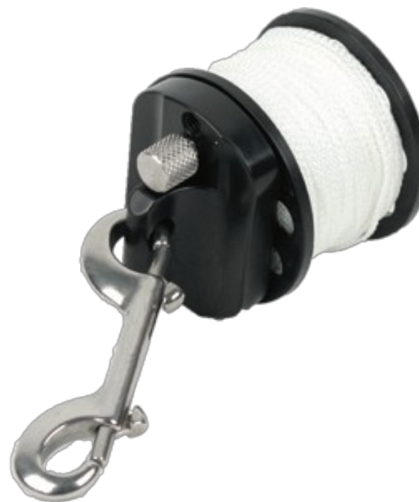
Defender Pro™ 150 z adapterem EasyGrip™